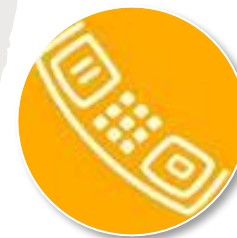
Nummer gegen Kummer